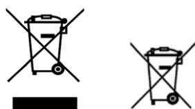
Symbol 1 Symbol 2

Spotřebitel musí být informován symboly níže, že příslušné elektrozařízení nepatří do komunálního odpadu. Jsou tak označena všechna nová elektrozařízení. Symbol může být uveden přímo na zařízení, na jeho obalu nebo v návodu k použití či v záručním listu.